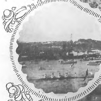
Aspecto de las regatas