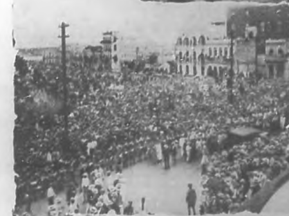
El pueblo frente al Palacio Presidencial