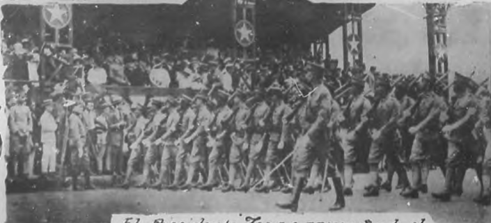
El Presidente Zayas presenciando el desfile de las tropas.