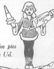
A los pies de Ud.

TRIZONE cuesta unos pocos centavos pero vale un tesoro. ¡Cómpralo hoy mismo!