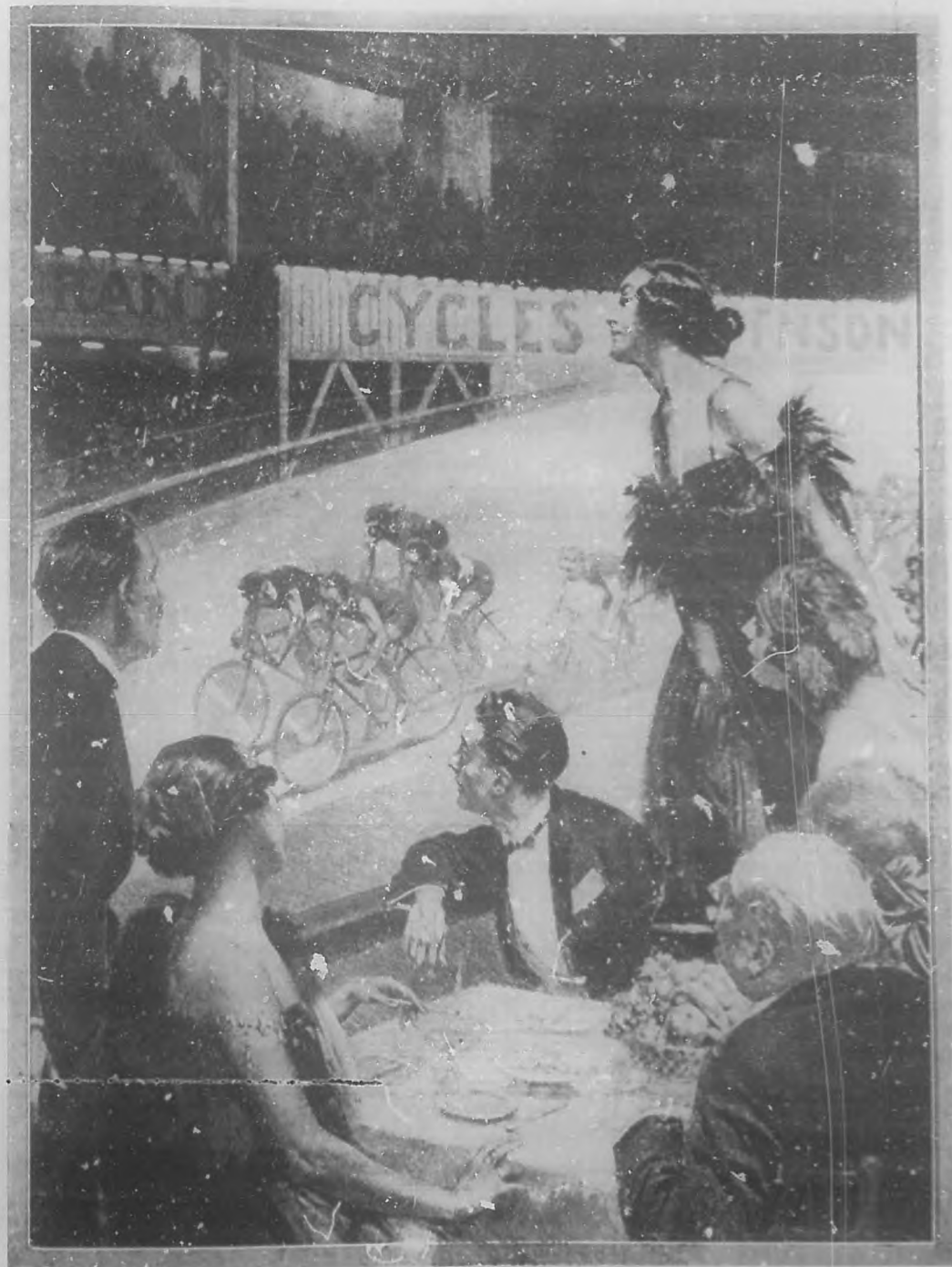
PARIS SE DIVIERTÉ

Un grupo de elegantes franceses presenciando las carreras de ciclistas llamadas de los "seis días", en el velódromo de D'Hiver.