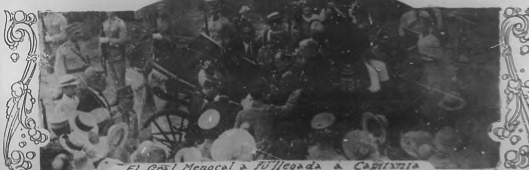
El Gral Menocal a su llegada a Capitanía