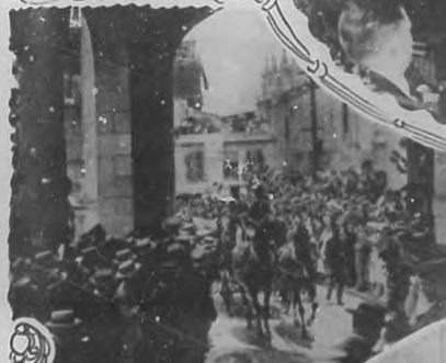
Llegada a Palacio del Dr. Zayas para hacerse cargo de la Presidencia de la Republica