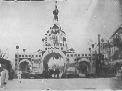
Arco levantado en la Capitanía del Puerto.