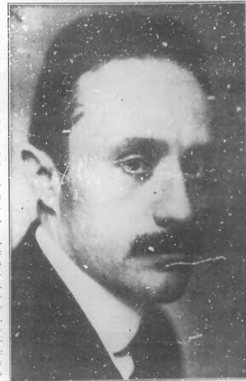
LICDO. JOSE VASCONCELOS

Ilustre intelectual que ocupa el alto cargo de Rector de la Universidad de México.