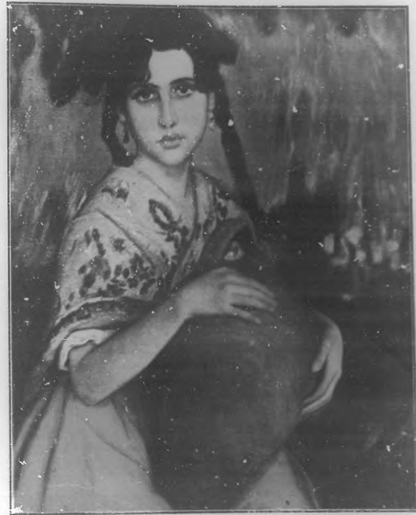
VALENCIANA Cuadro de Pinazo Martínez.