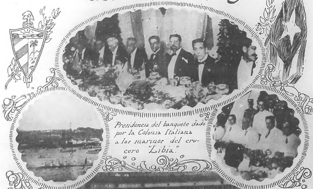
Presidencia del banquete dado por la Colonia Italiana a los marineros del crucero "Libia."