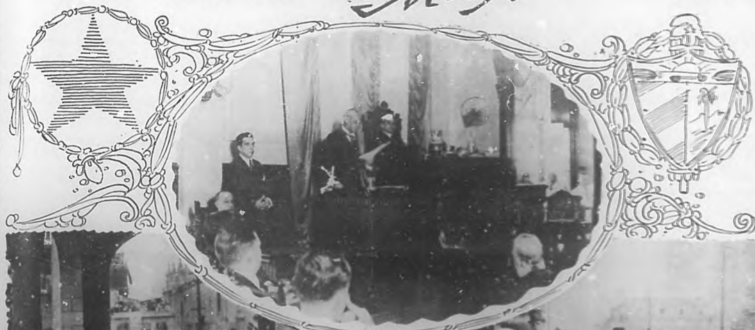
El Presidente Zayas leyendo su primer mensaje en el Congreso